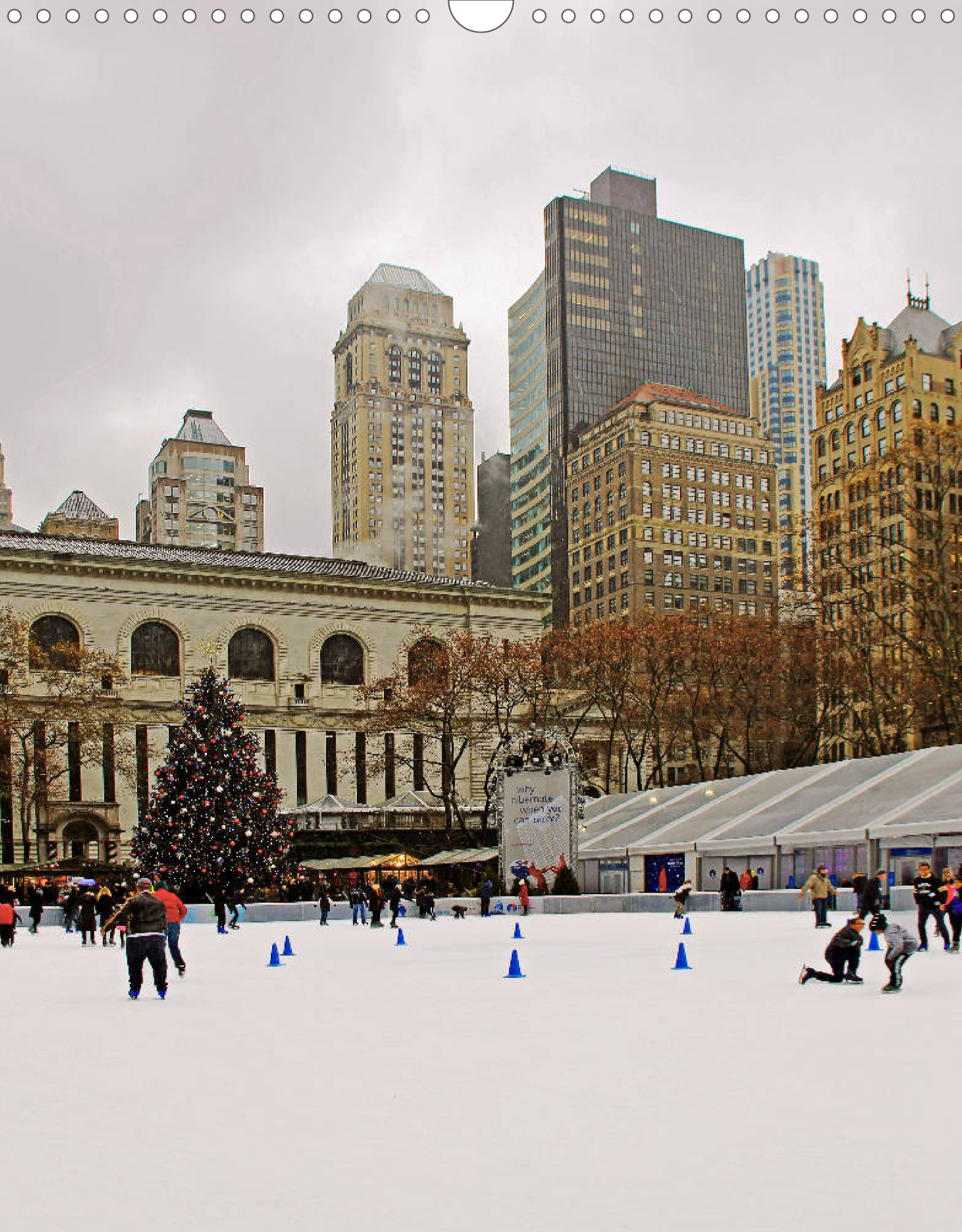
Bryant Park (Midtown Manhattan): kleine Grünanlage mit Restaurants, Brunnen, öffentlicher Bibliothek und beliebter Treffpunkt zu Events