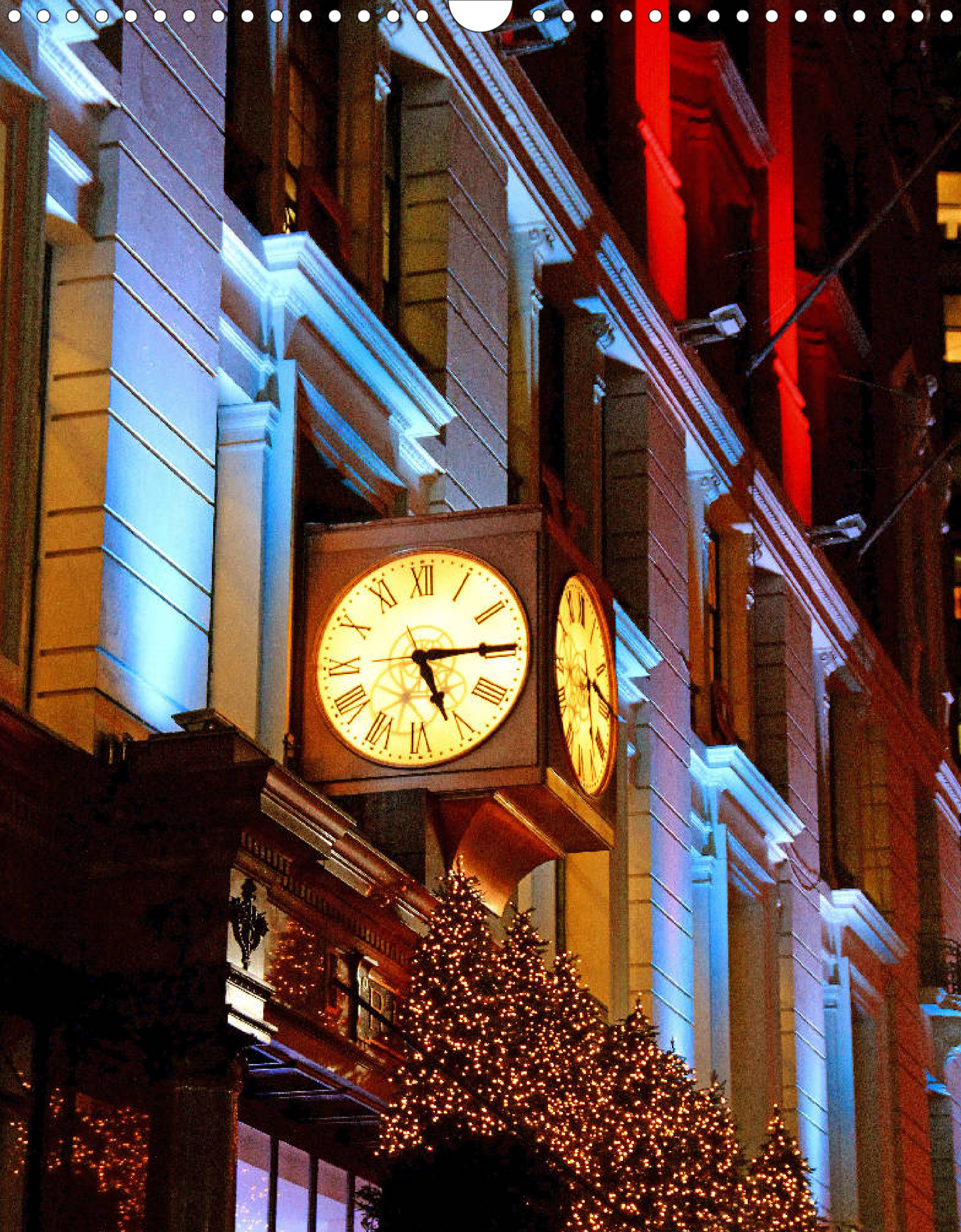
Garment District (Ecke Broadway und West 34th Street): Mode-Stadtviertel mit Herald Square, Einkaufsmeile und weltgrößtem Kaufhaus