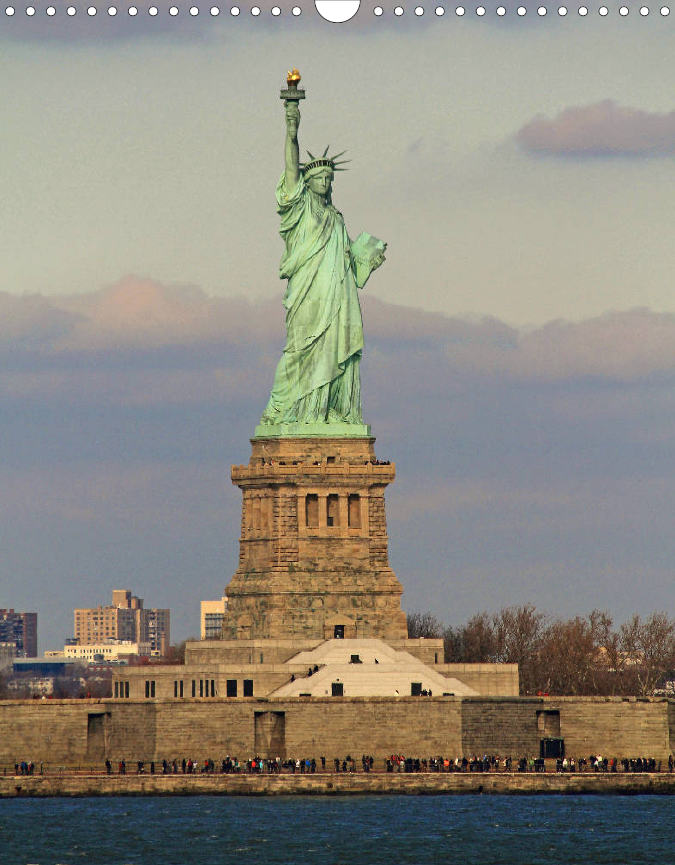
Freiheitsstatue (Liberty Island): 46 m hohes Wahrzeichen von Frédéric-Auguste Bartholdi im Hafen der Stadt und das am meisten fotografierteste Motiv