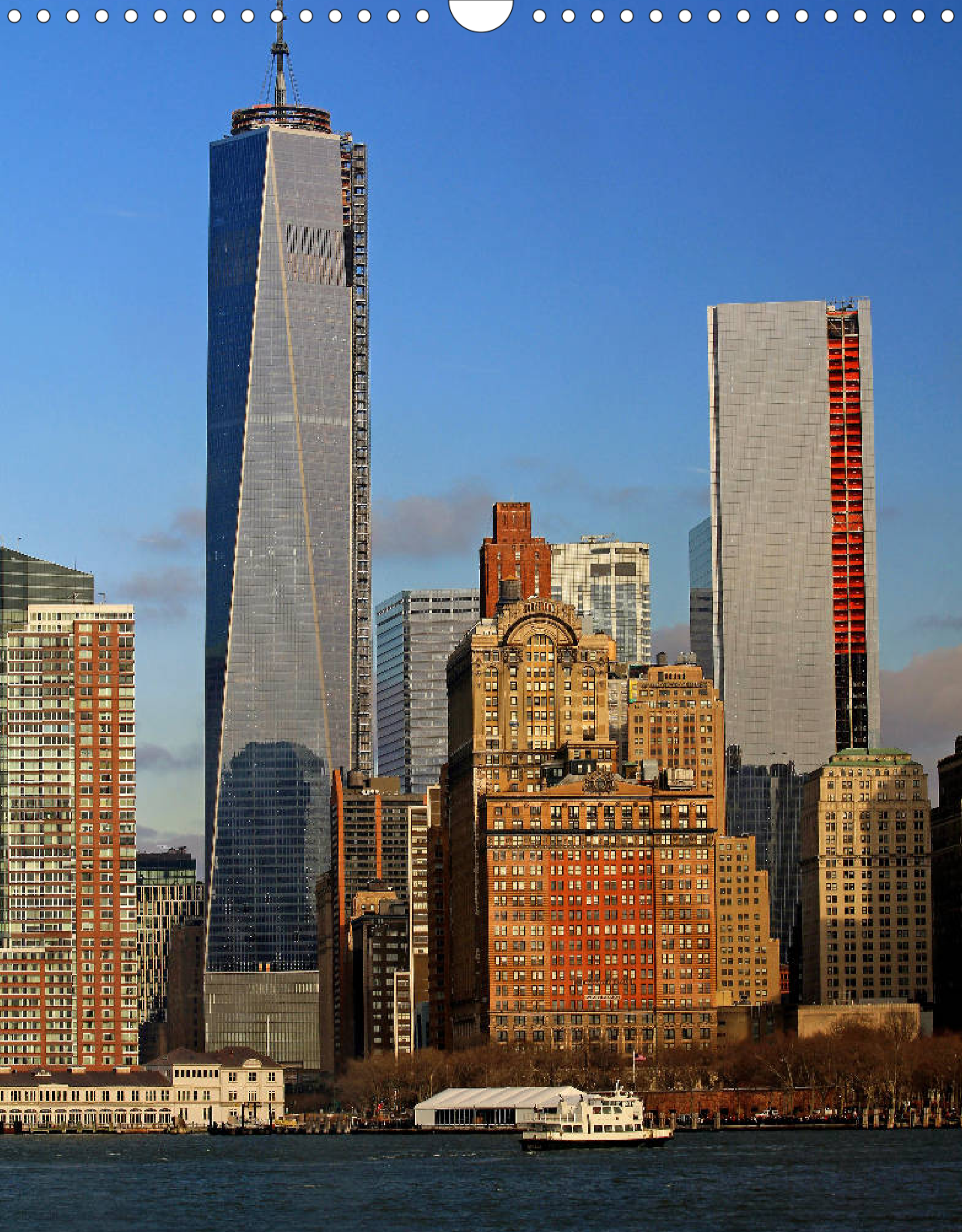
Manhattan Skyline (Financial District): Finanz-Stadtviertel mit Wall Street, Banken, Kanzleien, Verlage, Wolkenkratzern, Bars und Restaurants