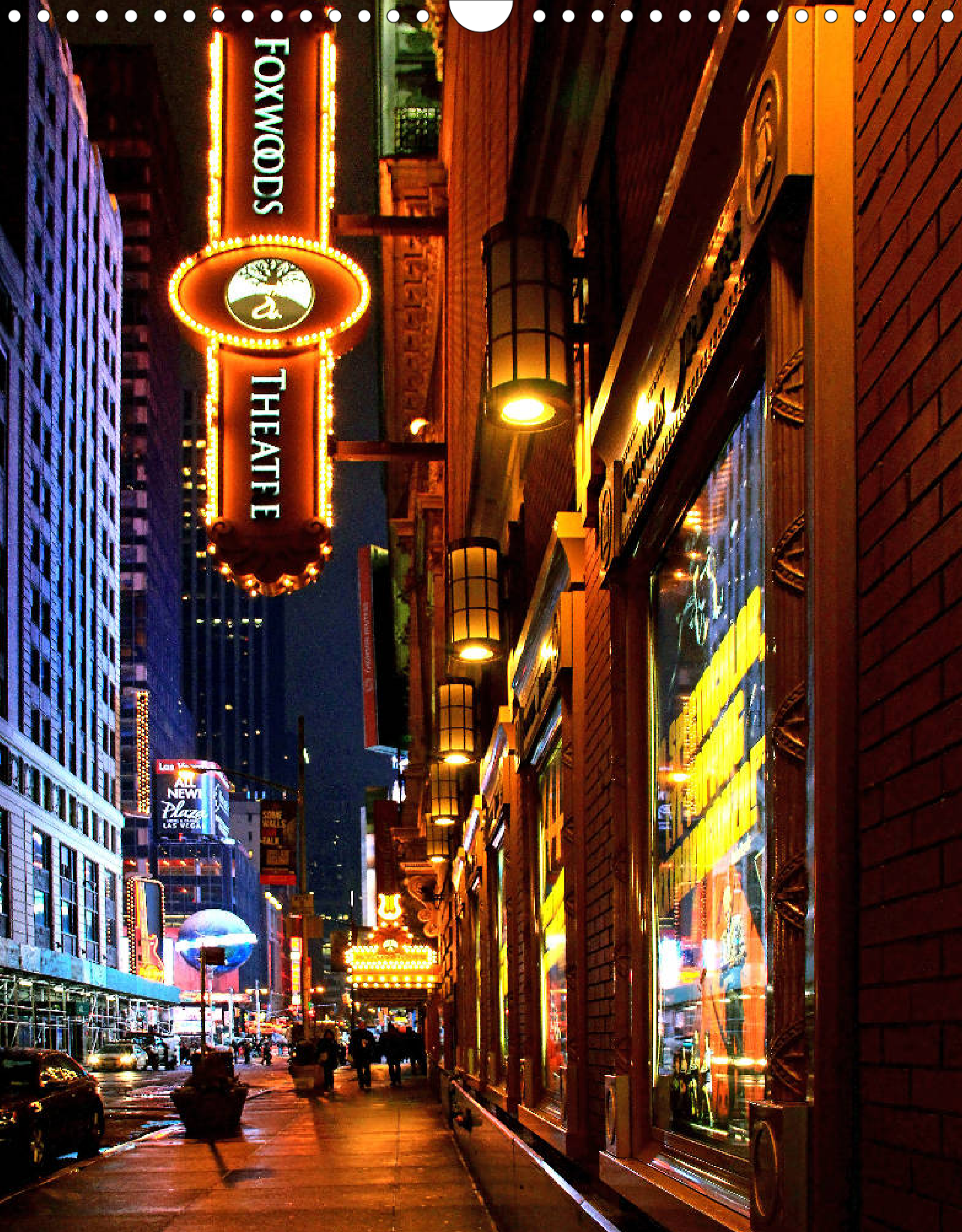
Midtown Manhattan (Ecke 7th Avenue und West 43rd Street): Nobel-Stadtviertel am Times Square mit Broadway und höchsten, bekanntesten Gebäuden