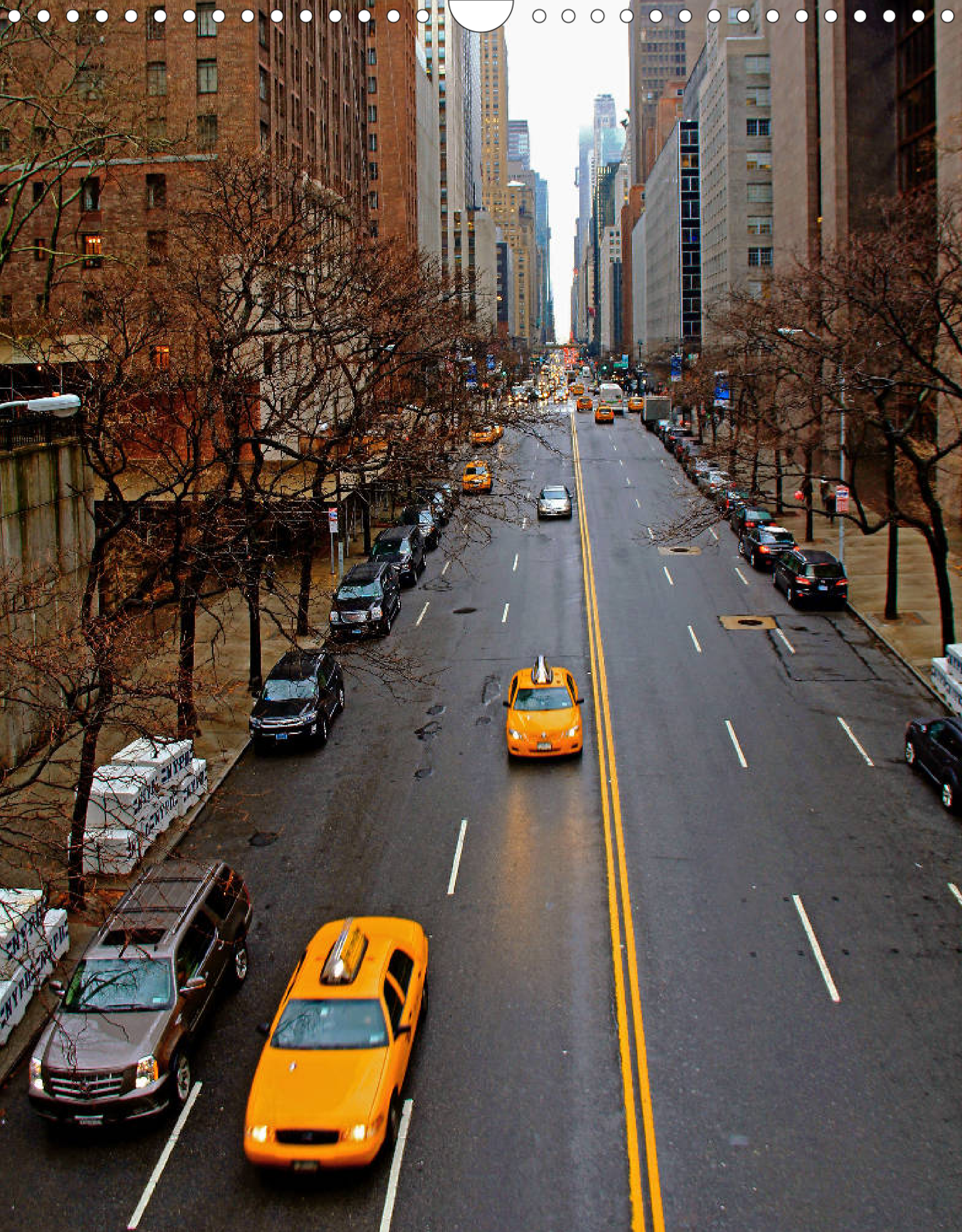
Tudor City (Ecke Tudor City Place und East 42nd Street): unter Denkmalschutz stehendes Stadtviertel mit zwölf Gebäuden und einigen Dachgärten