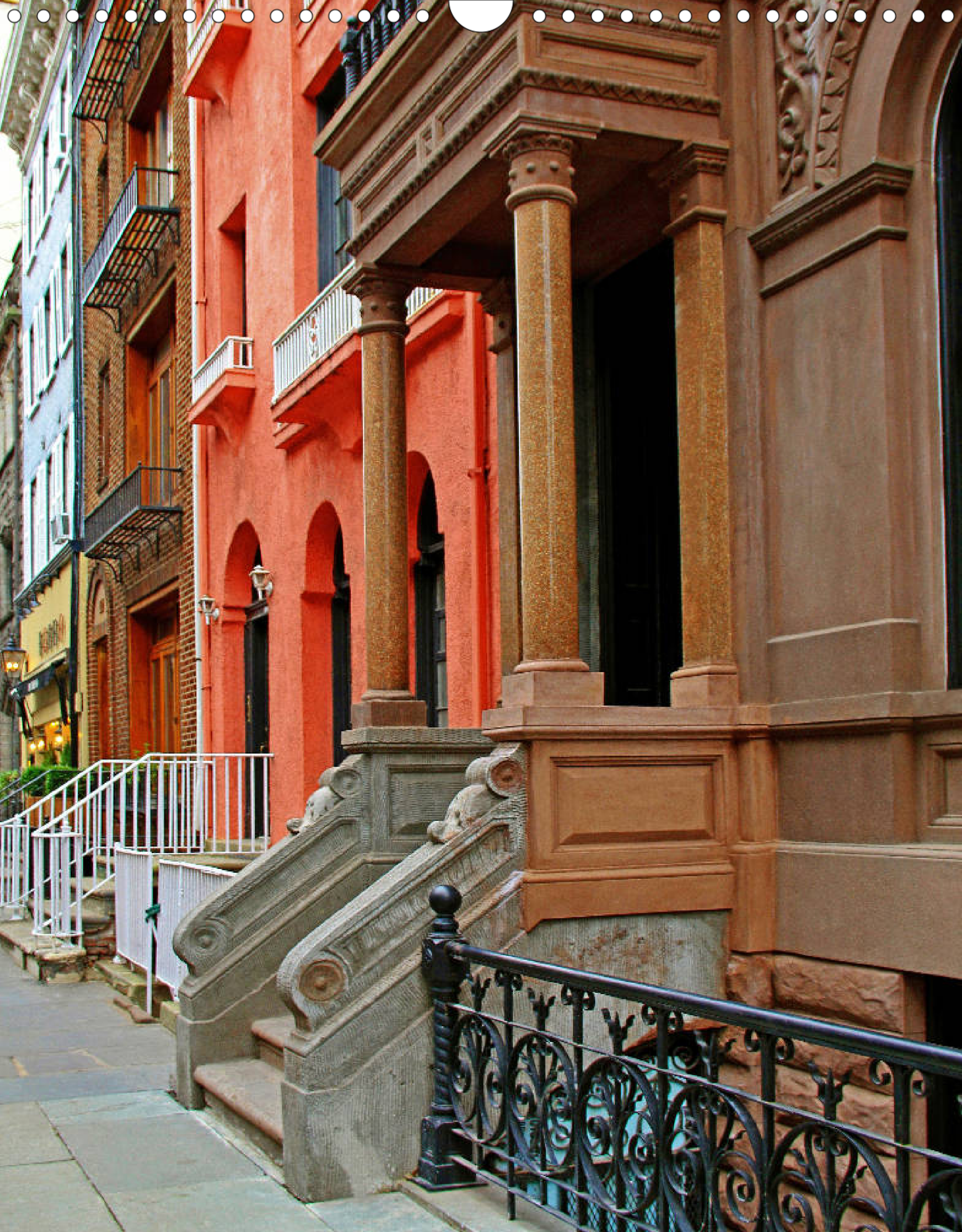
Greenwich Village: Künstler- und Szene-Stadtviertel in einem Wohngebiet mit Jazzclubs, kleinen Theatern und Washington Square Park