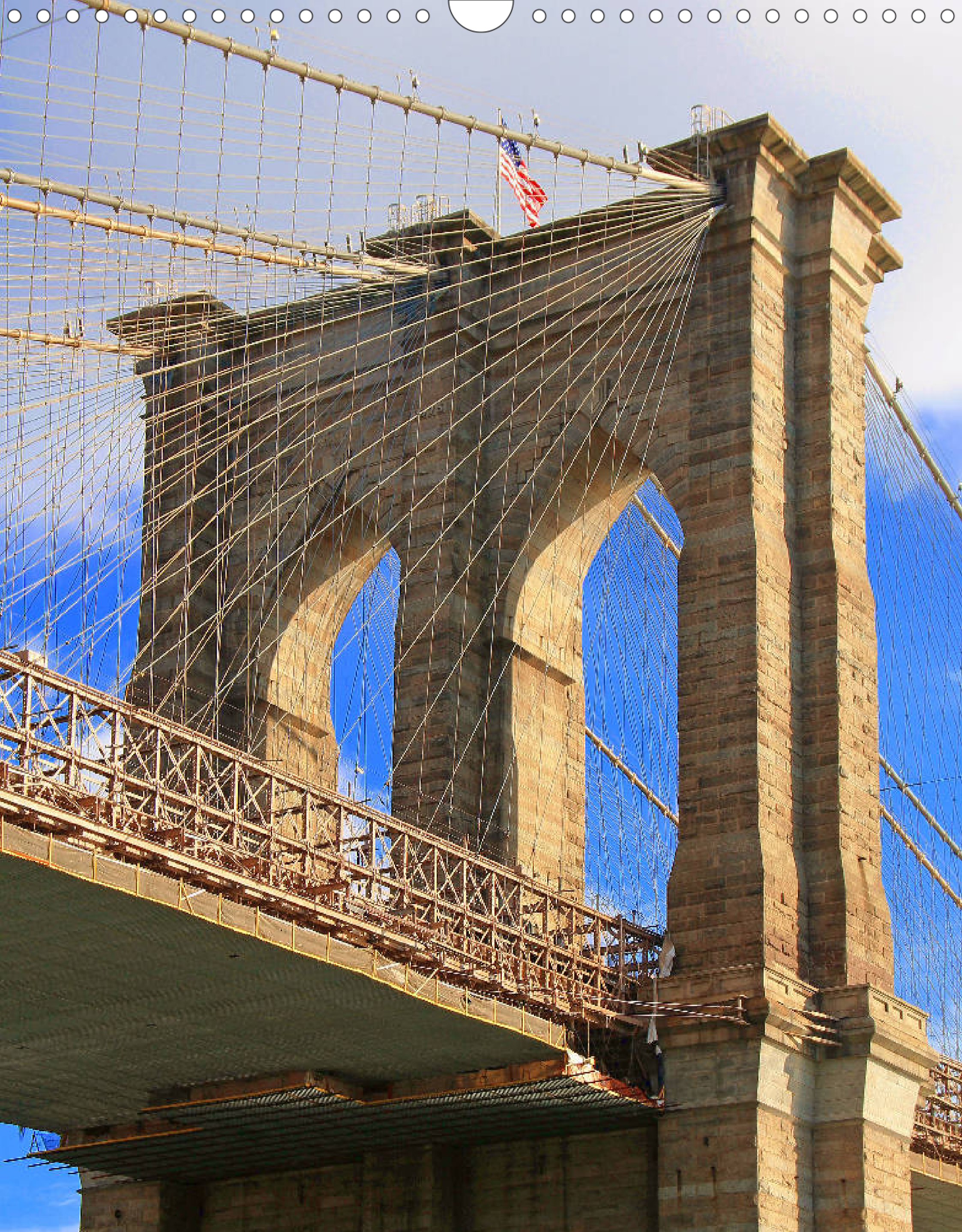
Brooklyn Bridge (Financial District): über den East River führend verbindet sie zwei Stadtteile als älteste Hänge- und Schrägseilbrücke der USA