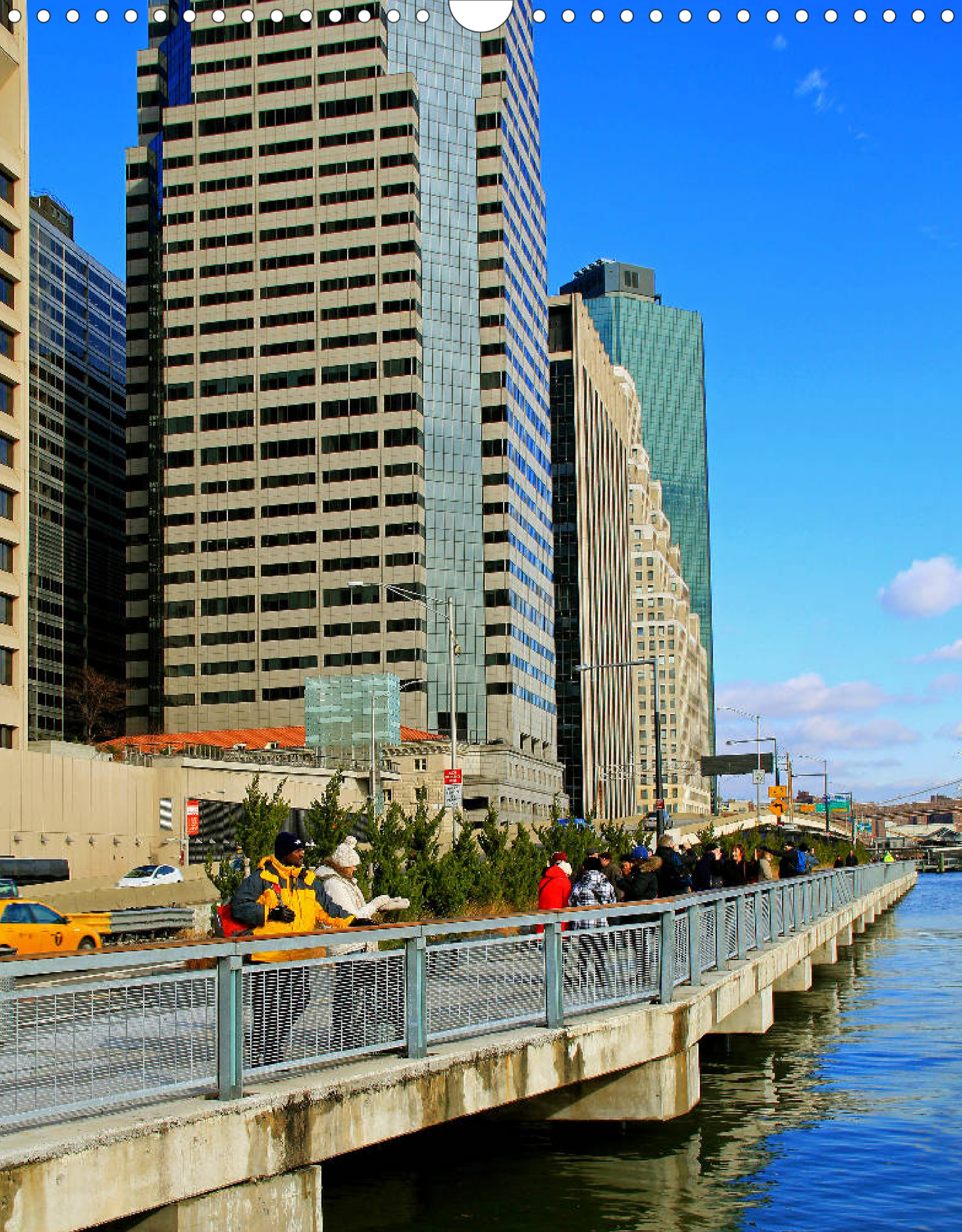
East River Bikeway (Financial District): 16 km lange Straße zum Wandern und Radfahren am Fluss zwischen Battery Park und Harlem