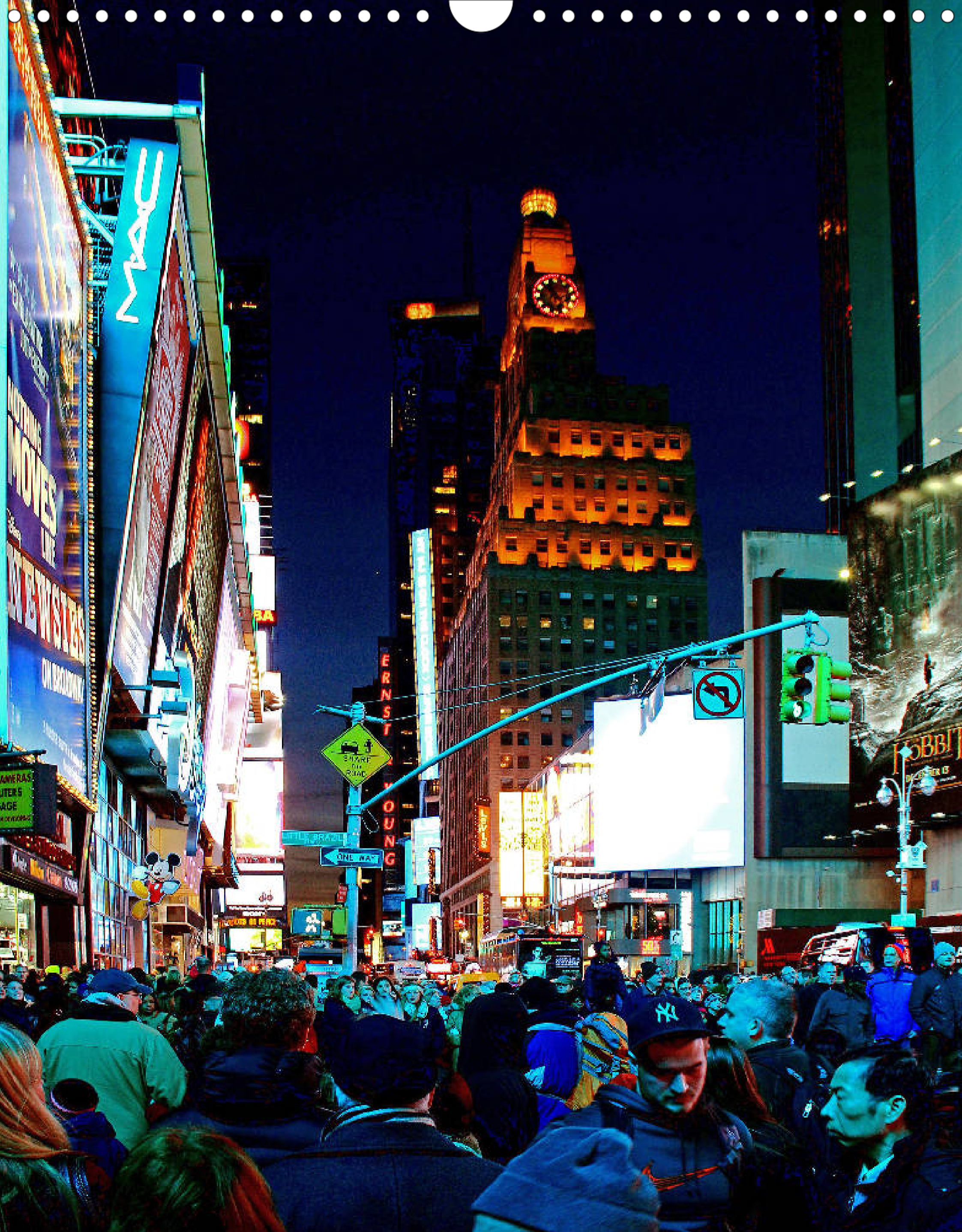
Theater District (Ecke Broadway und West 43rd Street): Stadtviertel am Times Square mit Leuchtreklamen, Läden, Cafés, Theatern und Kinos