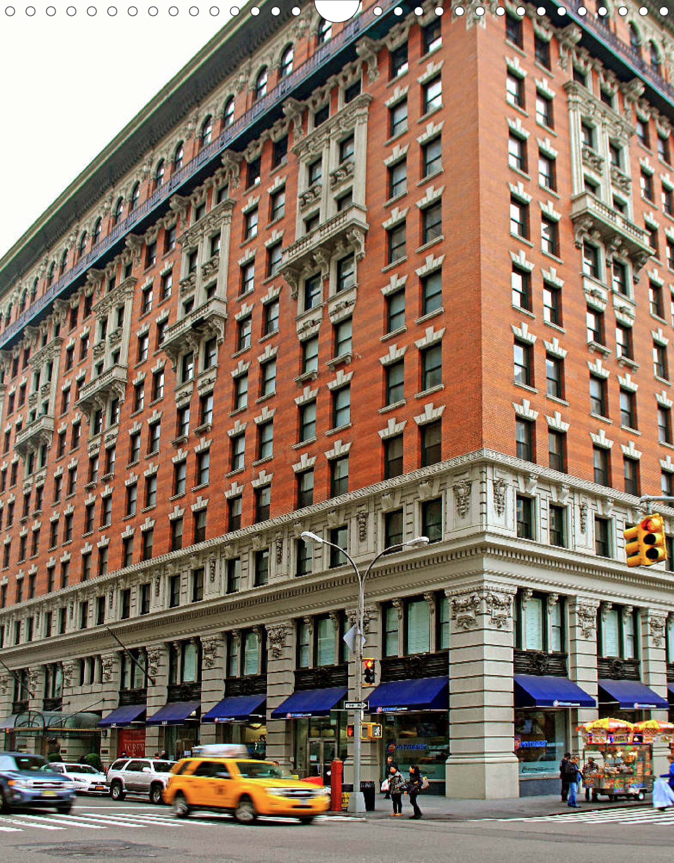
NoMad (Ecke 5th Avenue und East 26th Street): Stadtviertel mit Geschäften, Apartmenthäusern, Bars, Lounges und Madison Square Garden