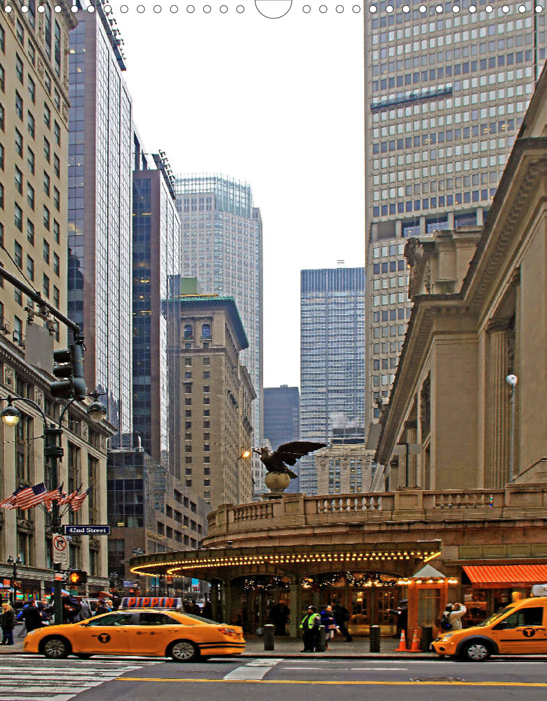
Turtle Bay (Ecke Vanderbilt Avenue und East 42nd Street): Stadtviertel mit Gebäuden im Art-déco-Stil, UNO-Hauptquartier und Grand Central Terminal